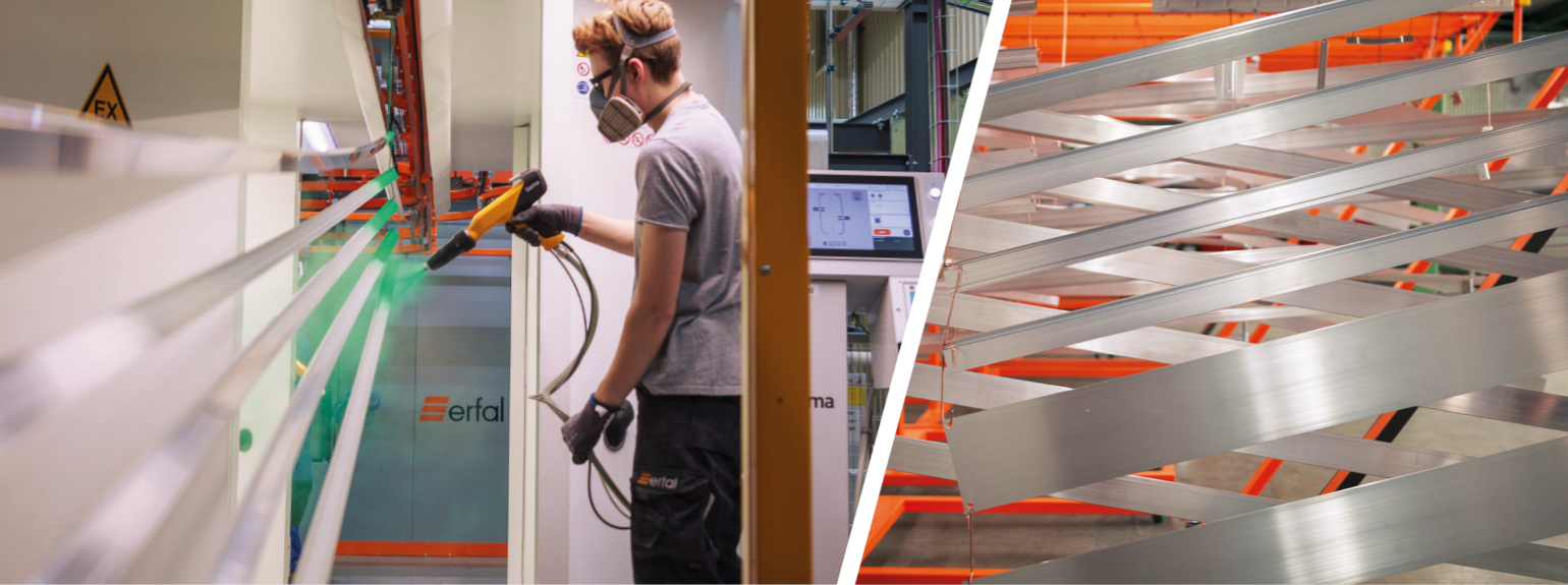
Neben dem hohen Qualitätsanspruch stehen bei der Produktion auch Nachhaltigkeit und Umweltschutz im Fokus.