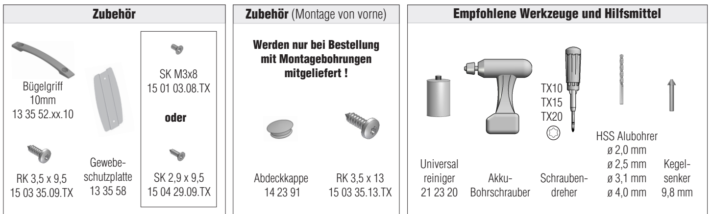
Abbildung: Montage von vorne

Bitte lesen Sie sich diese Montageanleitung aufmerksam durch. Für Fehler, die durch falsche Montage entstehen, übernehmen wir keine Haftung! Zur Montage ausschließlich Edelstahlschrauben verwenden.