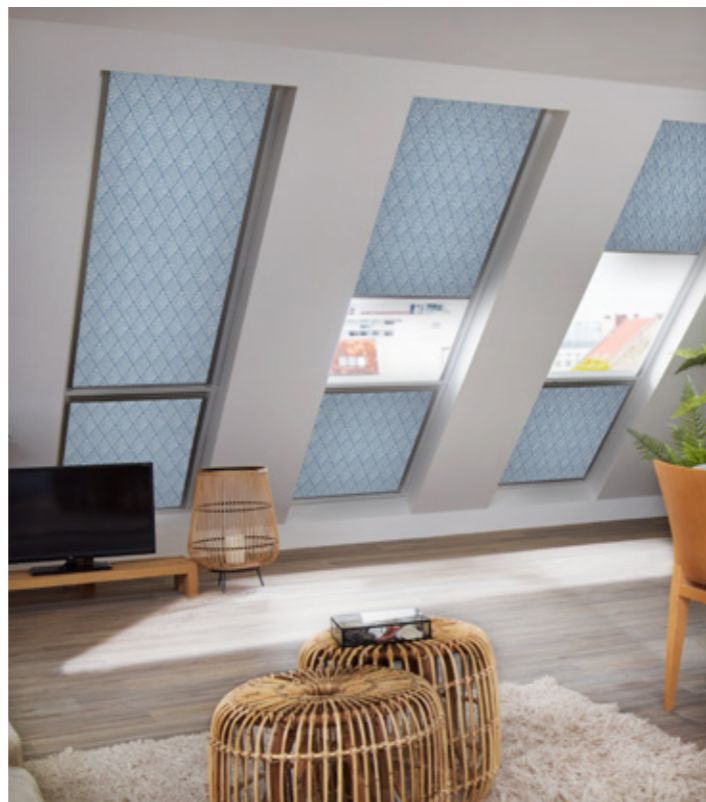
Maßgeschneiderte Rollos in verschiedenen Ausführungen bieten optimalen Schutz vor Überhitzung und passen sich dezent an jede Raumsituation an.