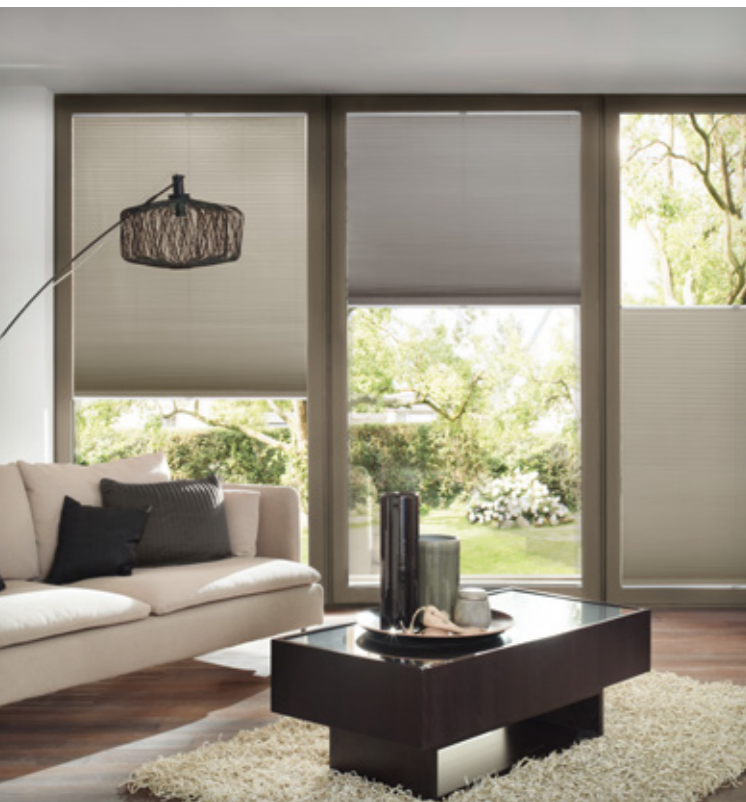
Wabenplissees wirken dank ihres Gewebefaufbaus multifunktional - Sonnenschutz, Abdunkelung, Hitzestopp, Kälteschutz, Energiesparen und Schallabsorption.

Flächenvorhänge sind wie geschaffen für große Fensterfronten und Glasflächen in modernen Wohnräumen und Büros. Als großflächige Sichtregulierung und durch flexible Verschiebbarkeit der Stoffbahnen lassen sich Flächenvorhänge auch als Raumteiler einsetzen.