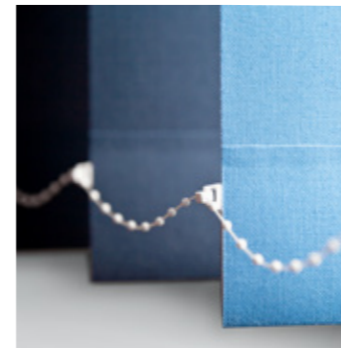
Wechsel verschiedener Farben und Materialien sowie individuelle Lamellenabschlüsse setzen Akzente und unterstreichen den persönlichen Wohnstil.