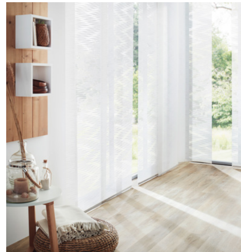
Als schmückende Accessoires und um den Behang beim Verschieben zu stabilisieren, können edle Applikationen, Abschlussprofile und Bediengriffe aus Holz oder Metall befestigt werden.