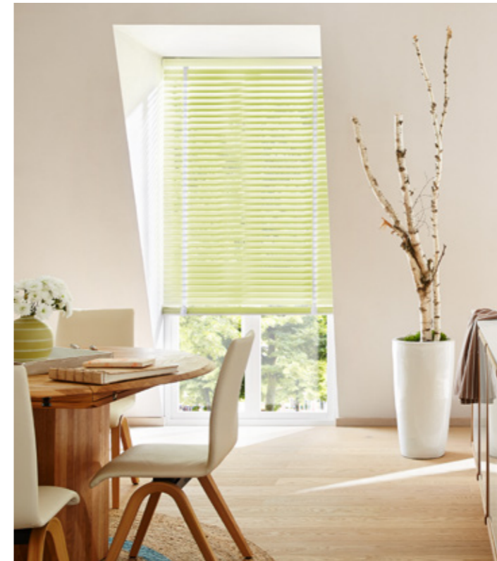
Perfekte Lösungen: Neben der klassischen Decken- oder Wandmontage können Jalousien auch am Fensterflügel, in der Glasleiste oder auf dem Dachfensterflügel montiert werden.