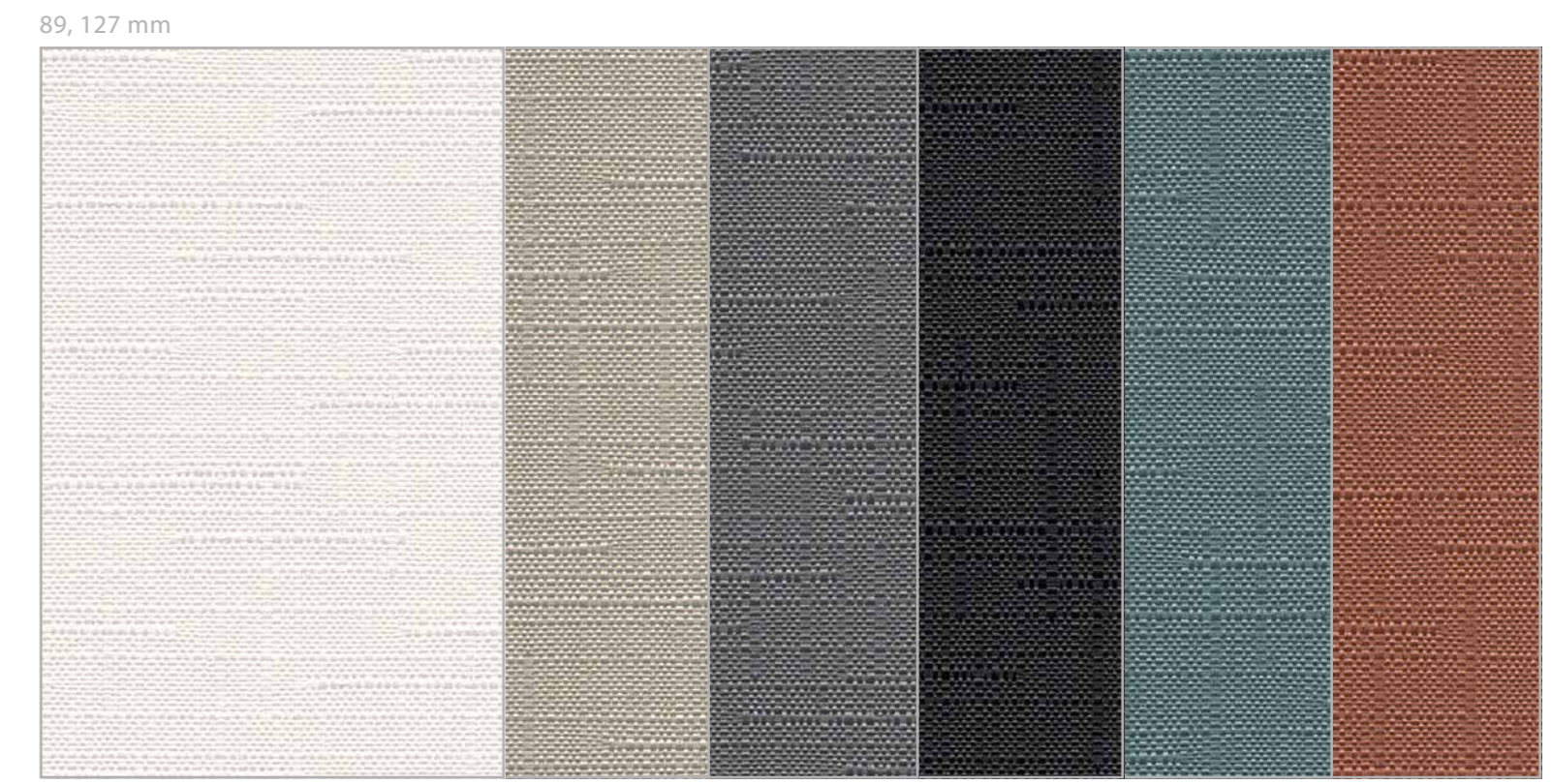
821.00 sirius, 821.12 sirius, 821.03, 821.04 sirius, 821.77 sirius, 821.06 sirius