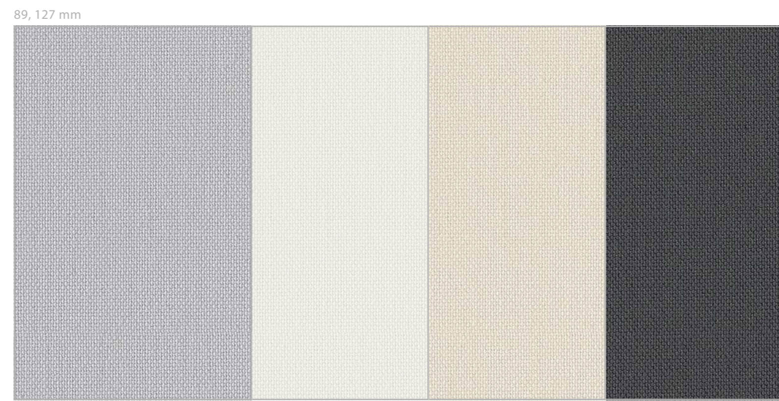
860.01 cadiz, 860.00 cadiz, 860.19, 860.03 cadiz