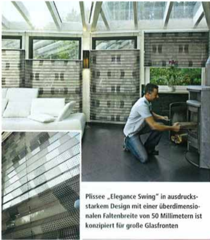
Plissee „Elegance Swing“ in ausdrucksstarkem Design mit einer überdimensionalen Faltenbreite von 50 Millimetern ist konzipiert für große Glasfronten

Erfal startet mit der neuen Kollektion „Deluxe“ in die Saisonsaison. Bereits im fünften Jahr veranstaltet der Sonnenschutzspezialist eine Hausmesse, auf der rund 20 Firmen ausstellen