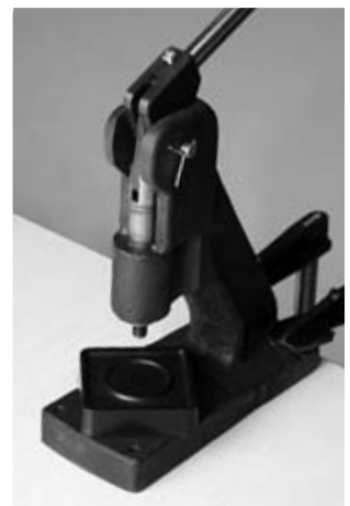
Stempel »eckig hochkant«