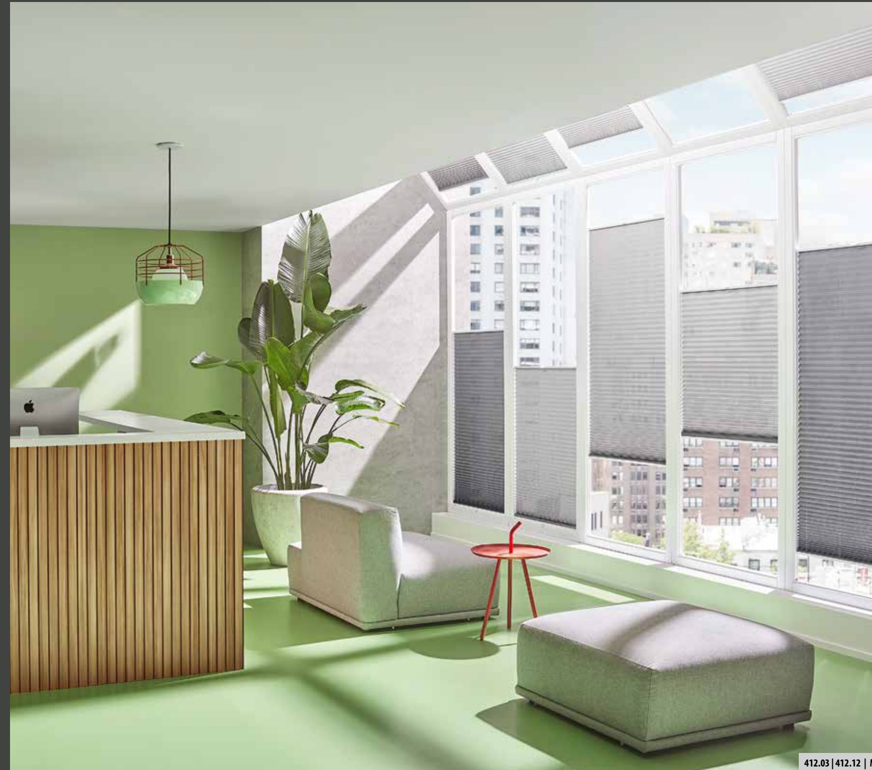
412.03 | 412.12 | M