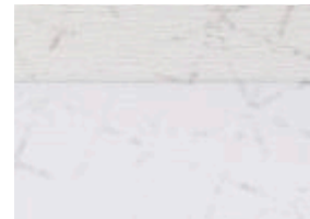
la plata 702.21