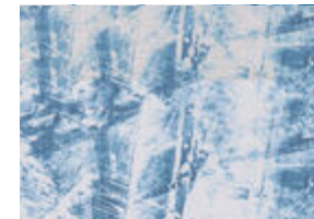
la plata 702.22